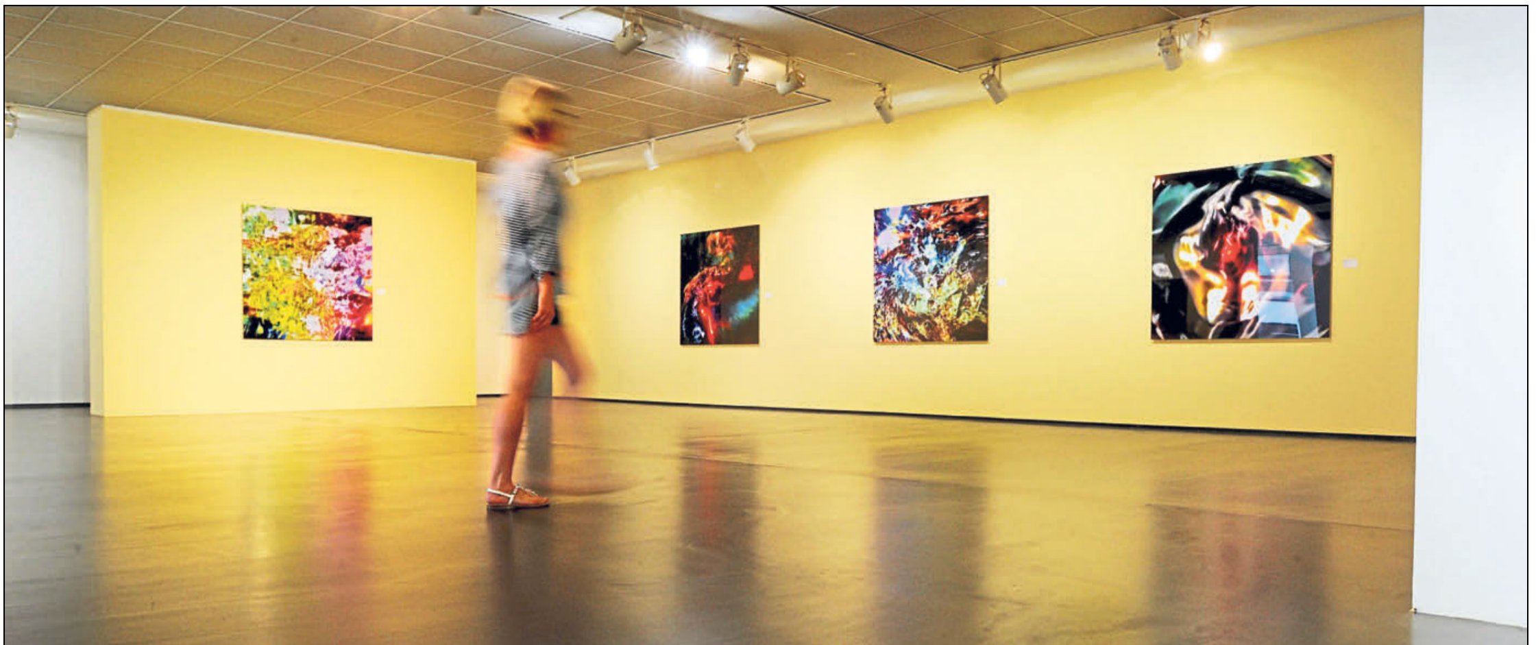
Werke von mystischer Aussagekraft empfangen die Besucherin in der Haupthalle der Samuelis Baumgarte Galerie.