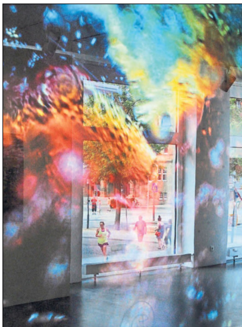
In einem Werk von Astrid Lowack spiegelt sich das Leben außerhalb der Galerie wider.

Wer sich darauf einlässt, kann sich in ihren licht- und farbintensiven Bildern mit ihrem wabernen Formenreichtum verlieren. Da wechseln gestochen scharfe