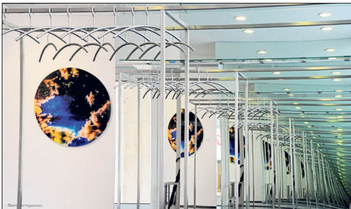
Die »Farben des Himmels«, vervielfältigt in einem Garderobenspiegel im Eingangsbereich der Galerie.

Ihre freien Fotoarbeiten folgen der Tradition des Impressionismus. Durch die Konzentration auf Details schafft Astrid Lowack eine Hyperebene, die die realistische Darstellung zugunsten einer eigenständigen Interpretation in den Hintergrund treten lässt. Die Schau in der Samuelis Baumgarte Galerie ist ihre erste große Einzelausstellung.