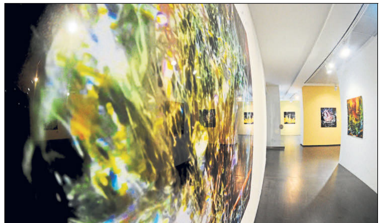
Bild und Abbild, Täuschung und Realität, gespiegelte Wirklichkeit.